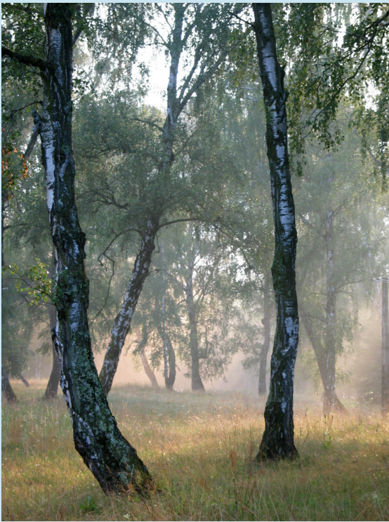
Báthory Péter: Rétyi Nyír a párás naplementében