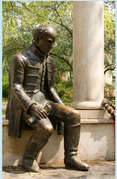
Szilas: Kölcsey Ferenc szobra Mátészalkán