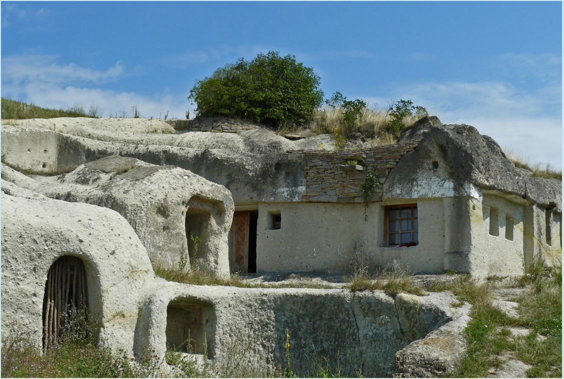
Ivanhoe: Barlanglakások a magyarországi Noszvajon