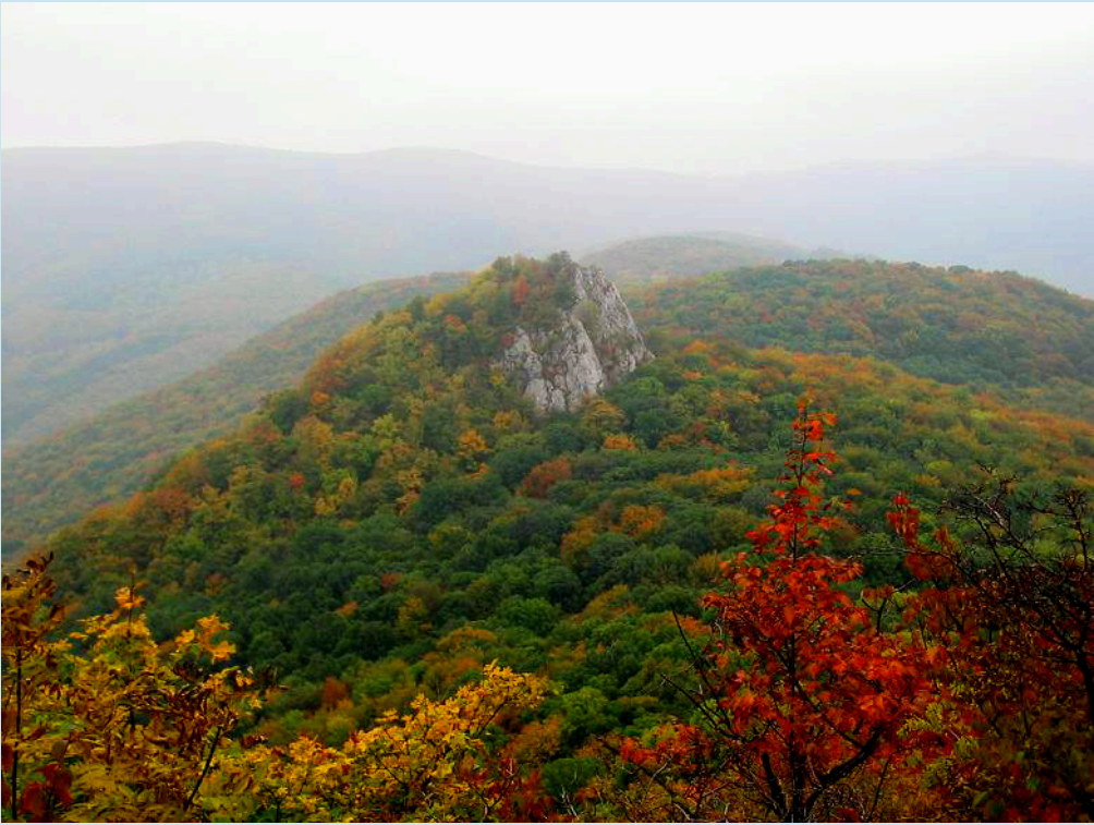
Nobli: Ősz a Bükkben