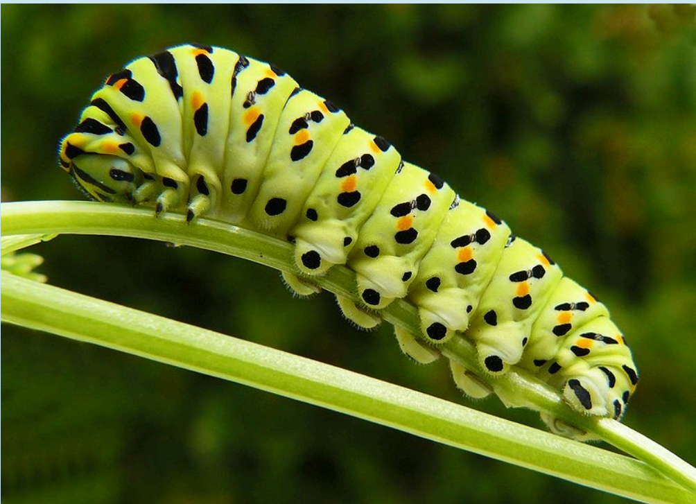
Ivanhoe: A fecskefarkú pillangó hernyója