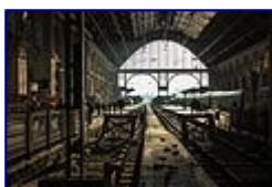
Keleti fények 7. helyezett