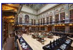
Egyetemi Könyvtár 3. helyezett

A nemzetközi pályázat nyertes magyar képei: