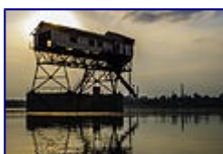
Szénrakodó-Esztergom 13. helyezett